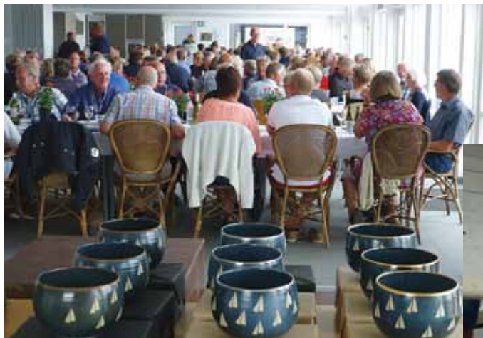
Spisning og hygge lørdag inden præmieuddeling.