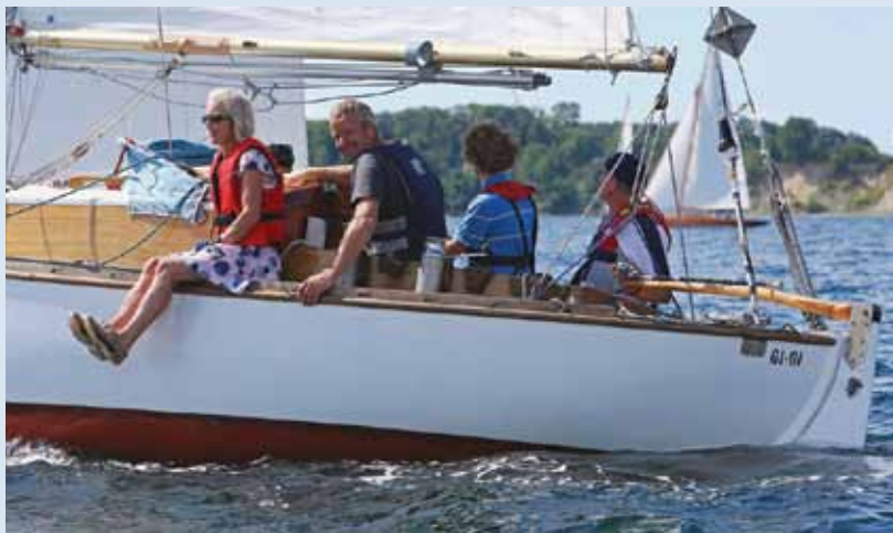
DFÆL holdt sommerstævne i Kerteminde den 10. - 13. juli.