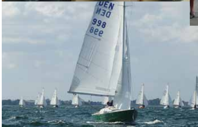
Private Lady DEN 998.