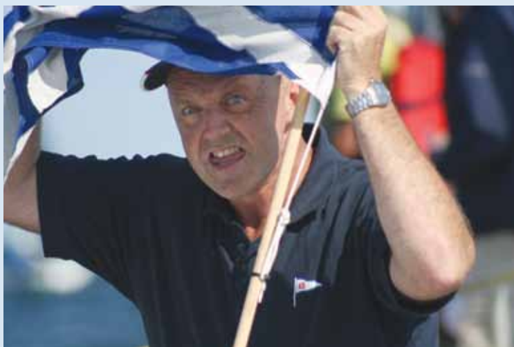
Alternativ signalering under Finn DM.