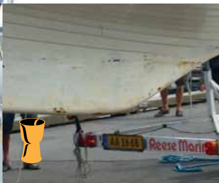
Køl og bund på vinderbåden af Guldpokalen 2014 !